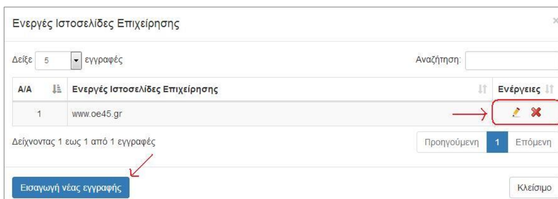
Εικόνα 12. Ενεργές ιστοσελίδες επιχείρησης