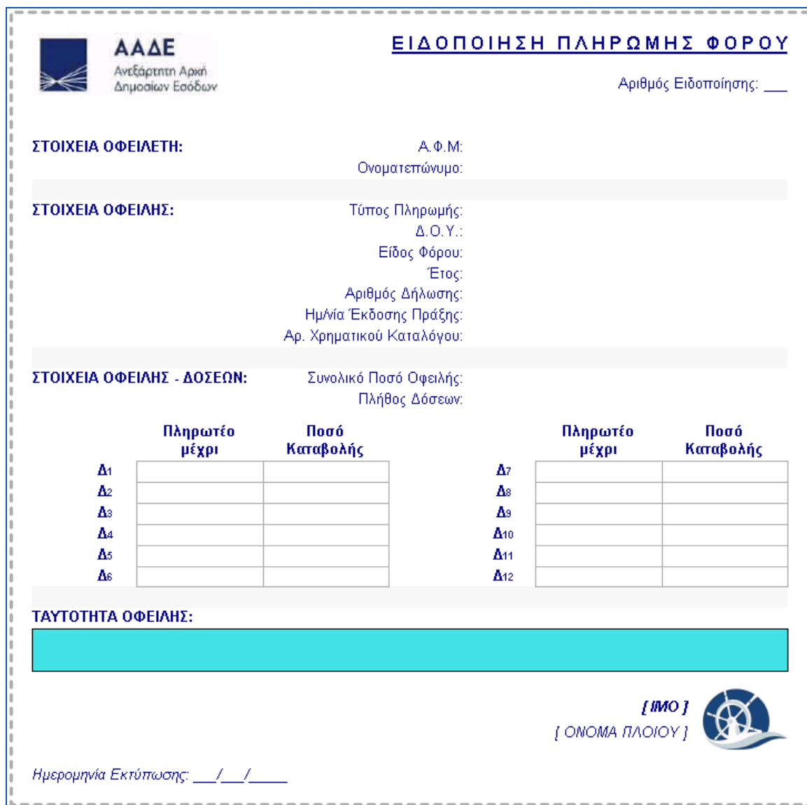
Εικόνα 19. Ειδοποίηση πληρωμής φόρου