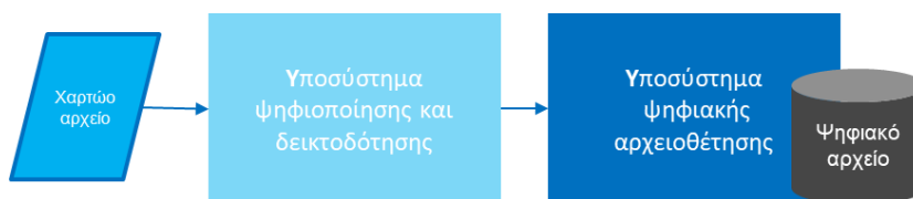
Σχήμα 1 - Λύση ψηφιακής αρχειοθέτησης του χαρτώου αρχείου

Η ροή εργασιών μεταξύ των δύο υποσυστημάτων (μεταφορά ψηφιακών φακέλων προς αρχειοθέτηση) τυποποιείται και αυτοματοποιείται.