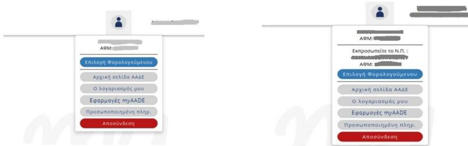
Εικόνα 3. Λογαριασμός σύνδεσης (αριστερά) και Εκπροσώπηση οντότητας (δεξιά)

Σε περίπτωση που ο χρήστης έχει λάβει εξουσιοδότηση ώστε να λειτουργεί έναντι τρίτης οντότητας (πχ λογιστής) θα εμφανιστεί επιπλέον η επιλογή Επιλογή Φορολογούμενου. Σε περίπτωση που έχουμε επιλέξει να εκπροσωπήσουμε τρίτη οντότητα εμφανίζει τα στοιχεία.