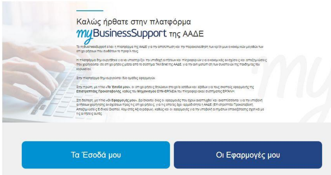
Εικόνα 1. Είσοδος στην πλατφόρμα “myBusinessSupport”

Για την είσοδο στην εφαρμογή, επιλέγετε «Οι εφαρμογές μου».