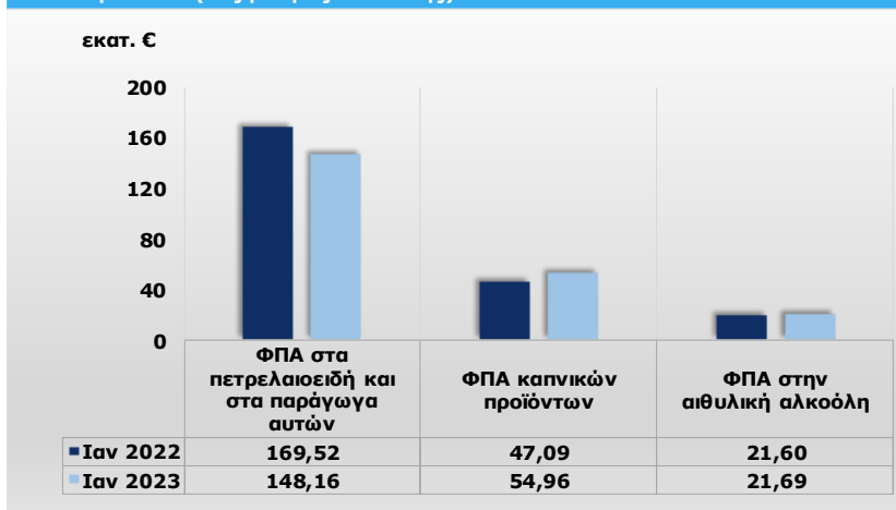
Γράφημα 2: Σύγκριση βασικών αναλυτικών λογαριασμών εσόδων από ΦΠΑ στα πετρελαιοειδή προϊόντα και στα παράγωγα αυτών, στα καπνικά προϊόντα και στην αιθυλική αλκοόλη σε εκ. € (5ος βαθμός ανάλυσης)