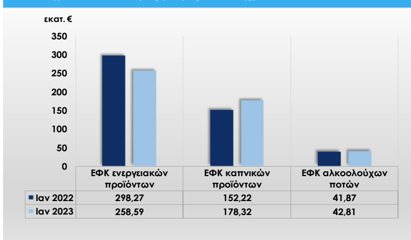
Γράφημα 3: Σύγκριση εσόδων από ΕΦΚ στα ενεργειακά προϊόντα, στα καπνικά προϊόντα και στα αλκοολούχα ποτά σε εκ. € (5ος βαθμός ανάλυσης)