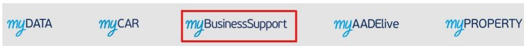
Εικόνα 1. Πρόσβαση στην υπηρεσία myBusinessSupport.

Η Εφαρμογή προσφέρεται ως εφαρμογή του Ο.Π.Σ. TAXISnet της ΑΑΔΕ και η είσοδος σε αυτήν πραγματοποιείται με τη χρήση των προσωπικών κωδικών του TAXISnet.