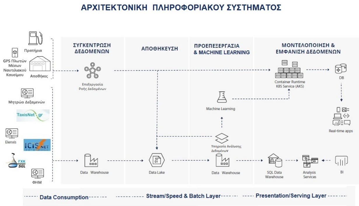
Εικόνα 1: Αρχιτεκτονική αναφοράς του συστήματος

Στην Εικόνα 1 αποτυπώνεται η λογική αρχιτεκτονική αναφοράς (reference architecture) του υπό υλοποίηση συστήματος.